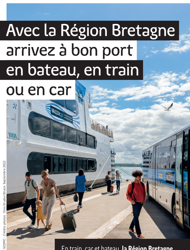
© SCOPIC - Crédits photos : Olo Studio/Stock - Septembre 2022

En train, car et bateau, la Région Bretagne transporte chaque année 60 millions de voyageurs grâce à BreizhGo, son réseau de transport public.